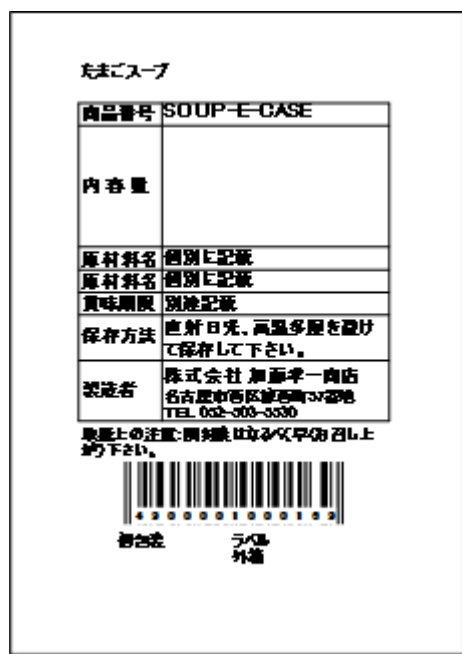
図 3 商品ラベルの印刷結果